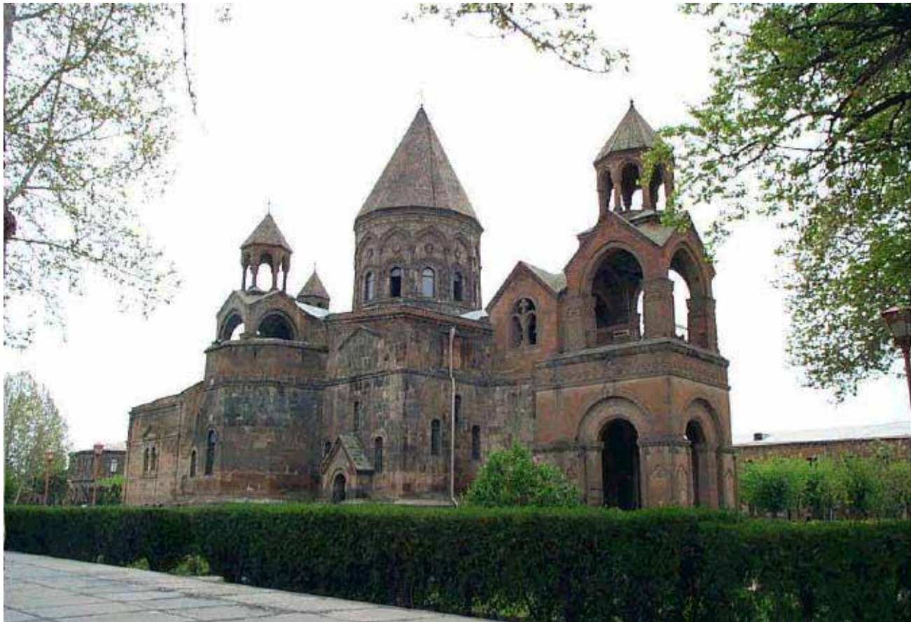
Ս. Էջմիածնի Մայր Տաճար