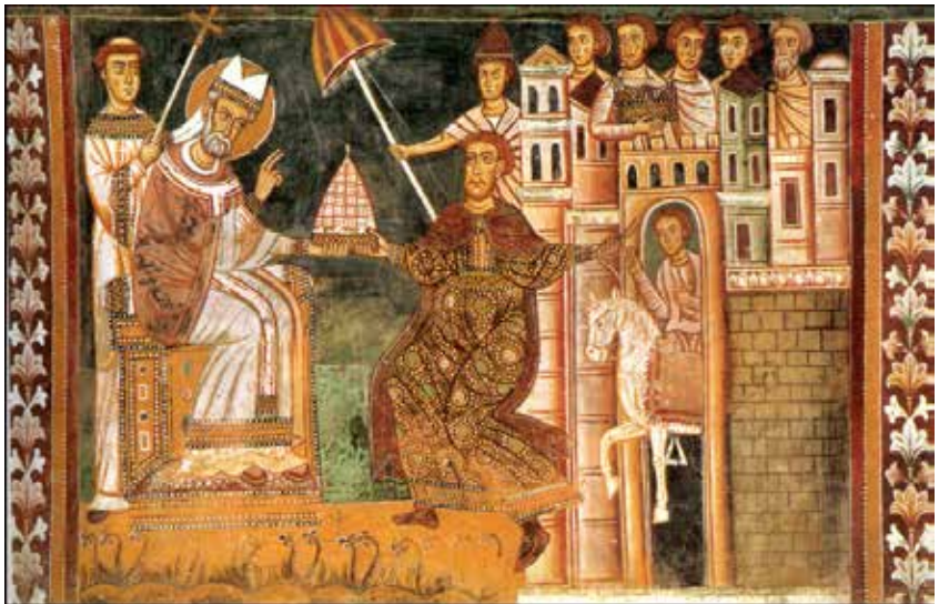
Միլվեսթր Ա. Հռոմի Պապը եւ Կոստանդիանոս կայսրը

Հեղինէ թագուհին Երուսաղէմի եւ շրջակայքին եկեղեցիներ եւ կուսանոցներ կառուցել կու տայ: Մահացած է 330 թուականին քրիստոնէաներու սրտերուն թողելով բարի յիշատակ: