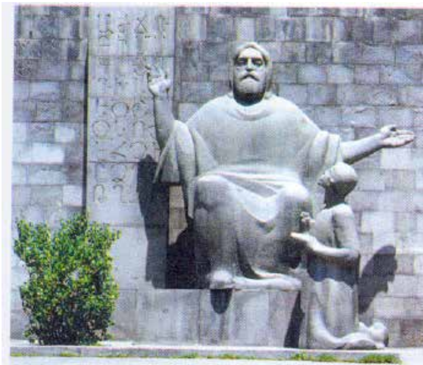
Մեսրոպ Մաշտոցի արձանը՝ Մատենադարանի մուտքին