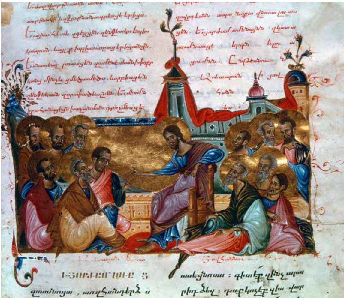
Յիսուս կը քարոզէ Առաքեալներուն