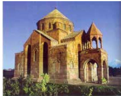
Էջմիածնի Ս. Հռիփսիմէ Վանքը