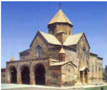
Էջմիածնի Ս. Գայիանէ Վանքը

Ստեփանոս Օրբելեանը կը գրէ թէ մինչեւ 13-րդ դար կաթողիկոսաբանին մէջ կը պահուէին Հռիփսիմէի մասունքները, որոնք Հռոմկլայի գրաւման ժամանակ (1292) մամլուքները տարած են Եգիպտոս որպէս աւար: Հռիփսիմէի գերեզմանը կը գտնուի Էջմիածնի Սուրբ Հռիփսիմէ վանքին մէջ: