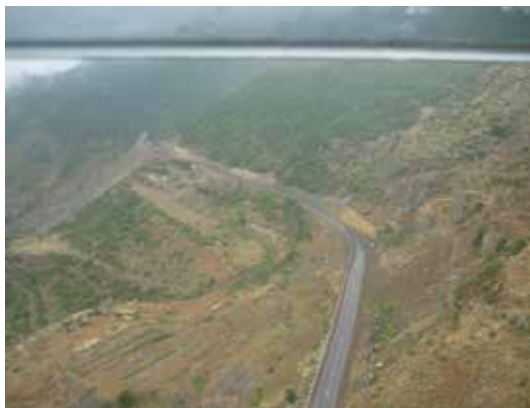
Ճոպանուղիէն վար դիտուած