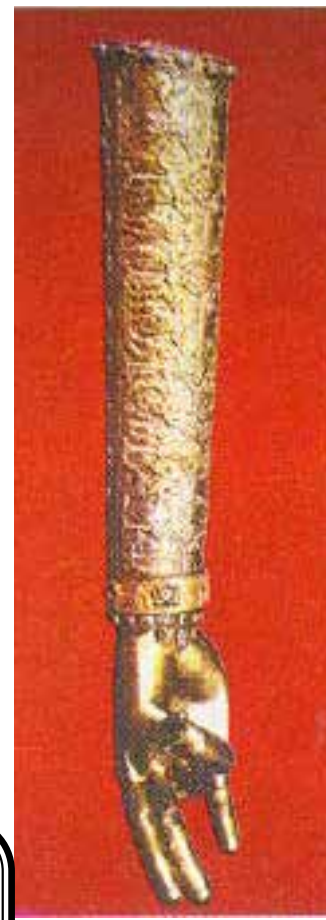
Սուրբ Գրիգոր Լուսավորիչի Աջը

Քարնանաբեր հնչումս հարաւային հողմոյն. ճառագայթեալ հրով աստուածային Հոգւոյն. որով հայլեցաւ սատն կռայաշտութեան հիւսիսաբնակ ազանց. եւ եղեն ծաղկեալք աստուածային գիտութեամբն: