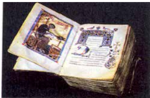
Միջնադարեան Հայ Չեռագիր, ԺԲ դար

Բոլորիս ծանօթ է նաեւ այն իրողութիւնը թէ առաջին գիրքը, որ հայերէնի կը թարգմանուի 408-415 թուականներուն միջեւ, Սուրբ Գիրքի Հին ուխտն էր կատարուած Եօթանասնիցէն: Նոյնքան հետաքրքրական է նաեւ զիտնալ թէ Նոր Ուխտի հայերէն լեզուով թարգմանութիւնը եղած է ասորերէն հին թարգմանութեան մը հետեւողութեամբ: Այս թարգմանութիւնն է որ կոչուած է «փութանակի թարգմանութիւն», որ կը նշանակէ հապճեպով, աճապարանքով կատարուած թարգմանութիւն: