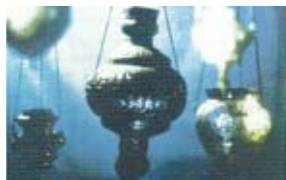
Կանթեղներ Ս. Էջմիածնի գանձատուն