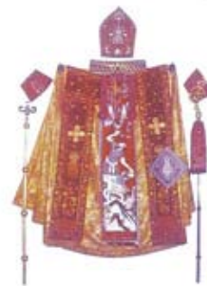
Կ ա թ ո ղ ի կ ո ս ի ծ ի ս ա կ ա ն հանդերձանքը Ս. Էջմիածնի Մայր տաճարի թանգարան