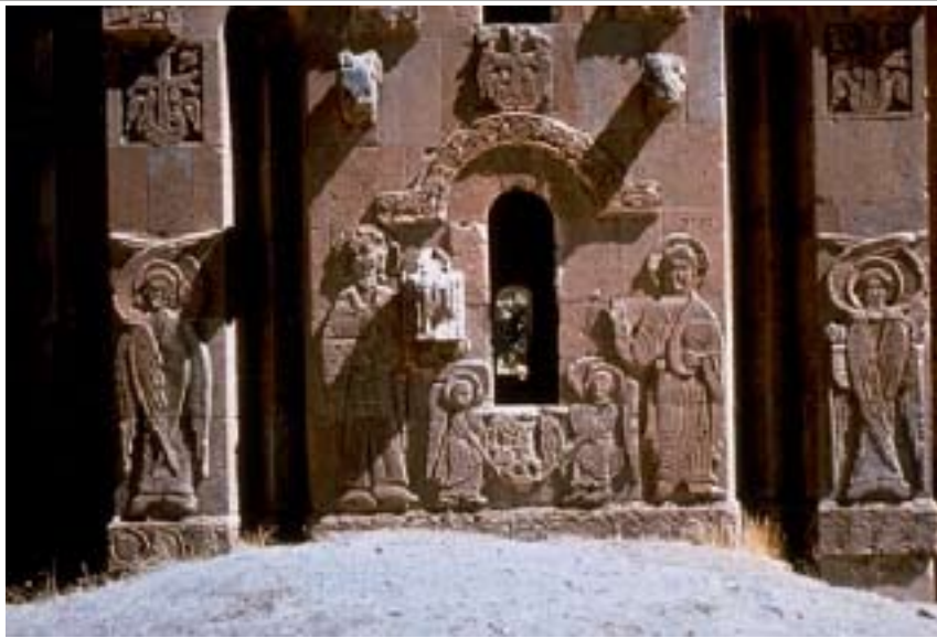
Հրեշտակներու քանդակներ Աղթամարի Սուրբ Խաչ եկեղեցւոյ ճակատին