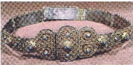
Գօտի ԺԸ դար, Կարս Ս. Էջմիածնի Գանձատուն