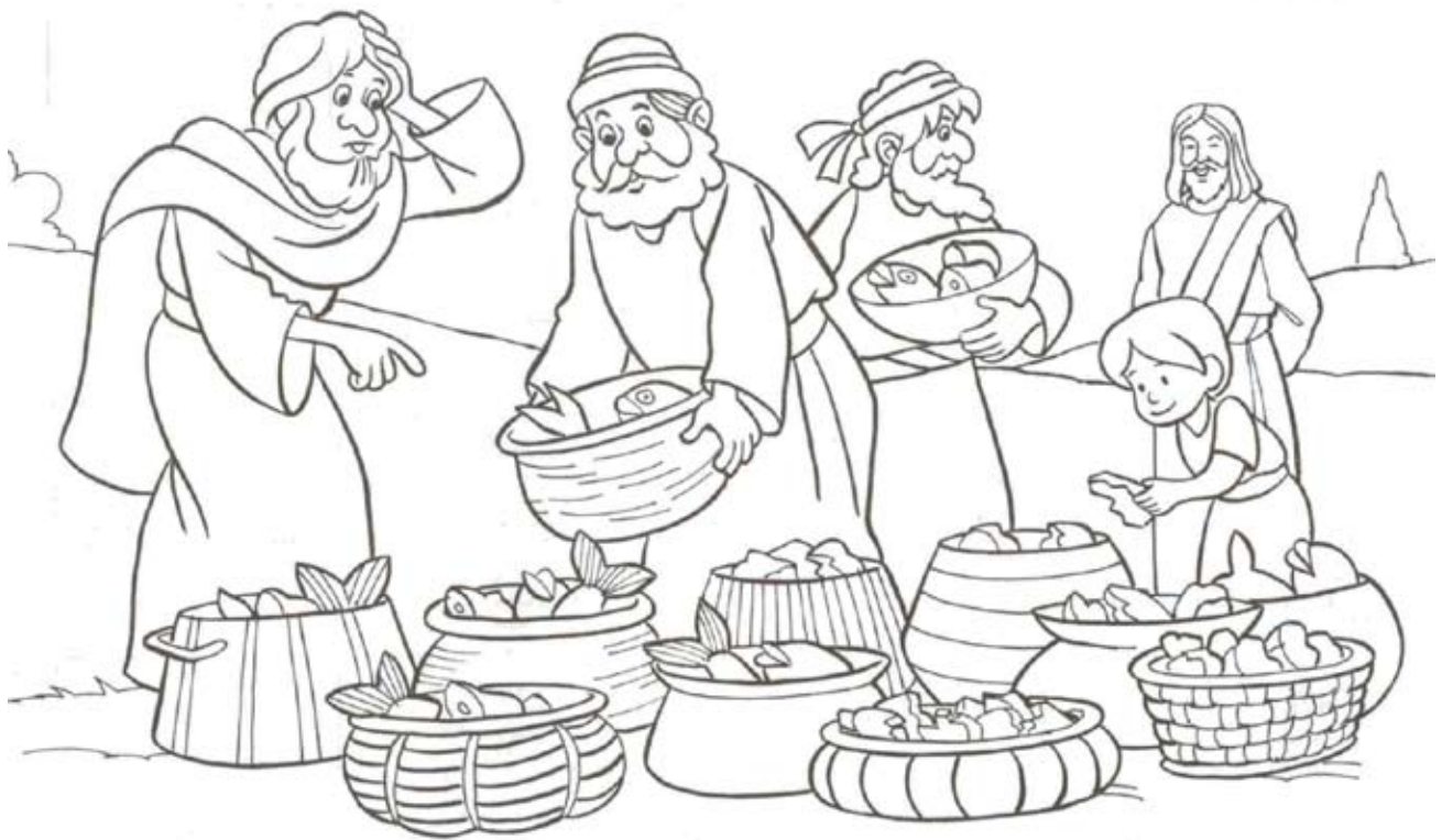
Ամէն մարդ կերաւ այնքան որ ուզեց: Եւ ինչ որ աւելցաւ, տասներկու կողով լեցուց:

Ամբողջացո՛ւր ըստ Ղուկասի Աւետարանին 9.14-17 .