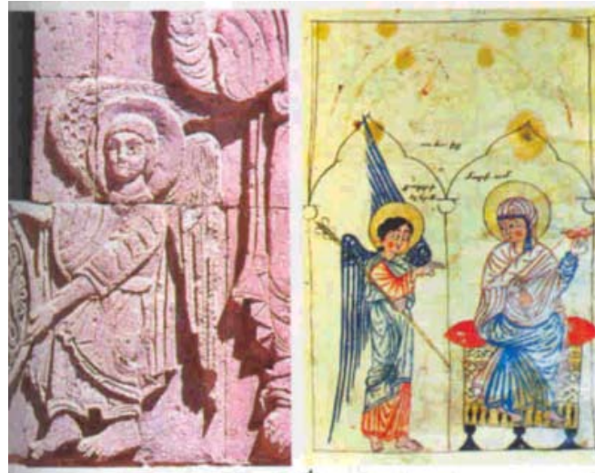
Հրեշտակի բարձրաքանդակը Աղթամար վանքի Ս. Խաչ եկեղեցւոյ ճակատին