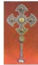
Սուրբ սեղանի խաչ Թ. դար սկիզբ, Ախալցխայ