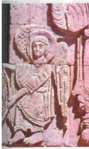
Հրեշտակի բարձրաքանդակը Աղթամար վանքի Ս. Խաչ եկեղեցւոյ ճակատին