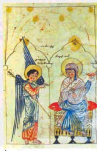
«Հրեշտակը եւ Ս. Մարիամը» 1330-ի Կիրակոս Աղբակեցիի «Աւետում» մանրանկարը