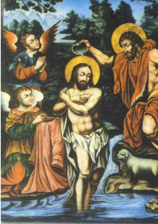
Մկրտութիւն Յովսափան Յովսափանեան