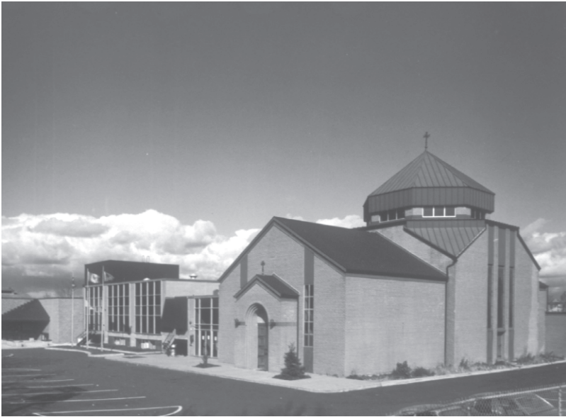
Այժմու Ս. Յակոբ եկեղեցին