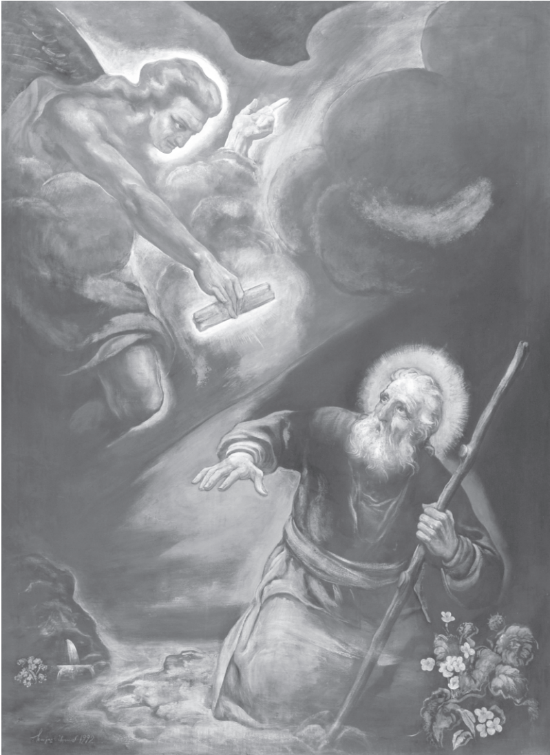
Սուրբ Յակոբ Մծբնացի եւ հրեշտակը