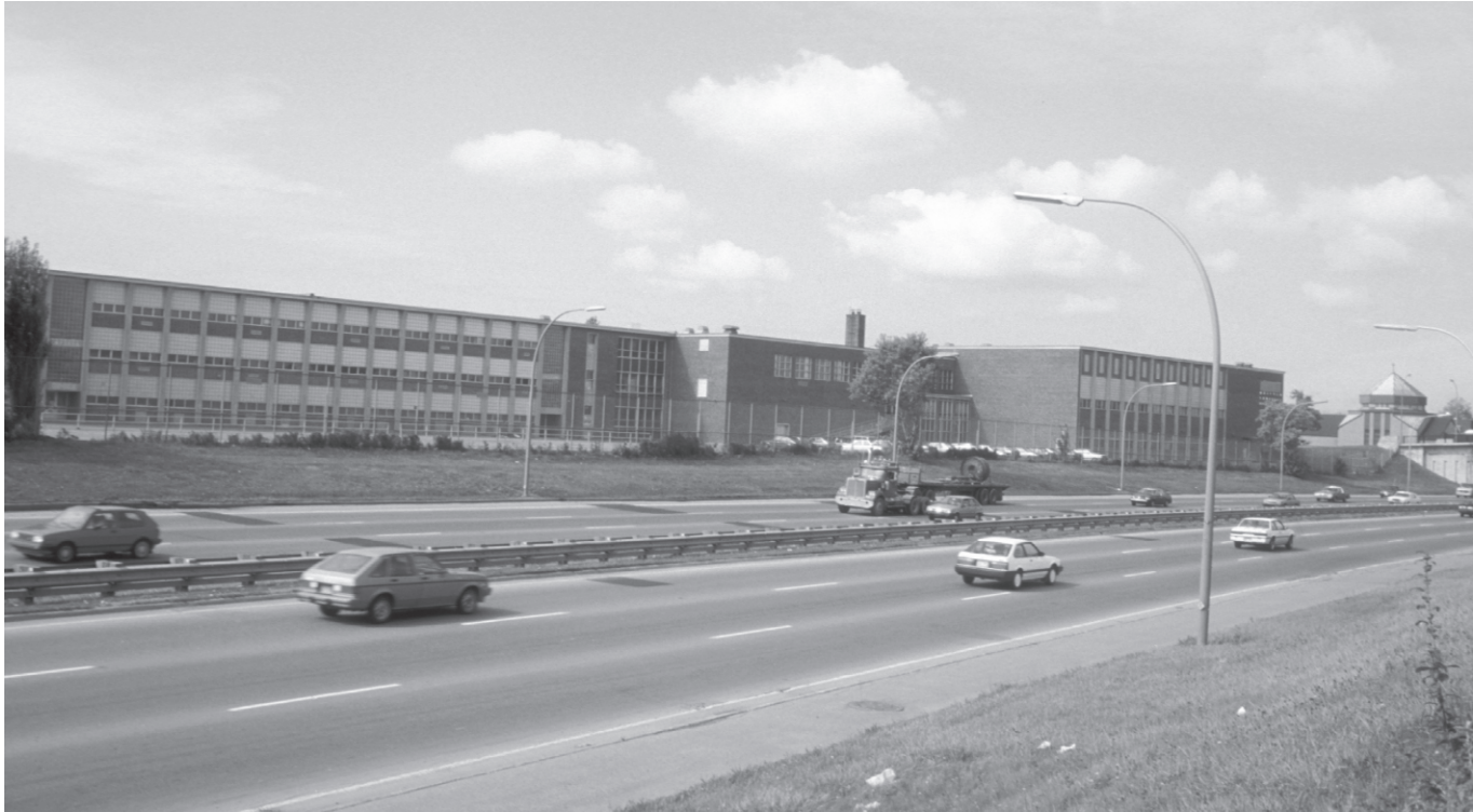
Դպրոցը եւ եկեղեցին