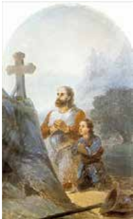
Վարդան Մամիկոնեանը որդիի հետ աղօթելու ժամանակ Աւարայրի ճակատամարտէն առաջ. Յովհաննէս Այվազովսկի

Հազարապետի, մաղխագի եւ մեծ դատավարութեան գործակալութիւնները վերստին գլխաւորեցան Վահան Ամատունին, Խորէն Խորխոռունին եւ Յովսէփ Վայոցձորեցին: Հայ նախարարները կը պատրաստուէին վերականգնել հայոց անկախ թագաւորութիւնը: Այդ նպատակով նախարարական տարբեր խմբաւորումներ առաջ կը քաշեն իրենց թեկնածուներուն: Հայոց զահր գրաւելու հաւակնութիւններ ունէին առաջին հերթին ապստամբութեան հիմնական ղեկավարները՝ Վարդան Մամիկոնեանը եւ Վասակ Սիւնին: Այդ մեծ նպատակին հասնելու համար անհրաժեշտ էր պարսիկներու դէմ պայքարի ընթացքին դաշնակիցներ ձեռք բերել, շարժման մէջ ներգրաւել հարեւան բախտակից ժողովուրդներուն: Դաշինք կնքելու եւ օգնութիւն ստանալու նպատակով հայերը դիմեցին Բիւզանդիոնի: Մակայն կայսրը ոչ միայն մերժեց հայերուն, այլեւ վերստին հաստատեց պարսիկներու հետ հին դաշինքը եւ անոնց խոստացաւ չօգնել հայերուն: Բիւզանդիոնը պարսից արքունիքին նաեւ տեղեակ պահեց հայերու ապստամբական ծրագրերուն: Միաժամանակ Հայաստանի բիւզանդական մասի հայ իշխաններուն արգիլուեցաւ օժանդակել իրենց պարսկահպատակ ազգակիցներուն: