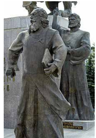
Յովսէփ Ա Վայոցձորցիի արձանը Գիւմրիի մէջ

Հայոց մարգպանը, հայ հոգեւոր առաջնորդները եւ նախարարները, որոնցմէ են նաեւ կաթողիկոսի տեղապահ Յովսէփ Վայոցձորեցի Արտաշատի մէջ հրաւիրեցին յատուկ ժողով: Մասնակիցներէն էին նաեւ Մեսրոպ Մաշտոցի եւ Մահակ Պարթեւի աշակերտները, որոնք քաջատեղեակ էին ժամանակի աստուածաբանական ու փիլիսոփայական գրականութեան: Պարսից արքունիքին ուղղուած պատասխան նամակին մէջ անոնք հիմնաւորապէս կը պաշտպանէին քրիստոնէական հաւատքի ճշմարտացիութիւնը: