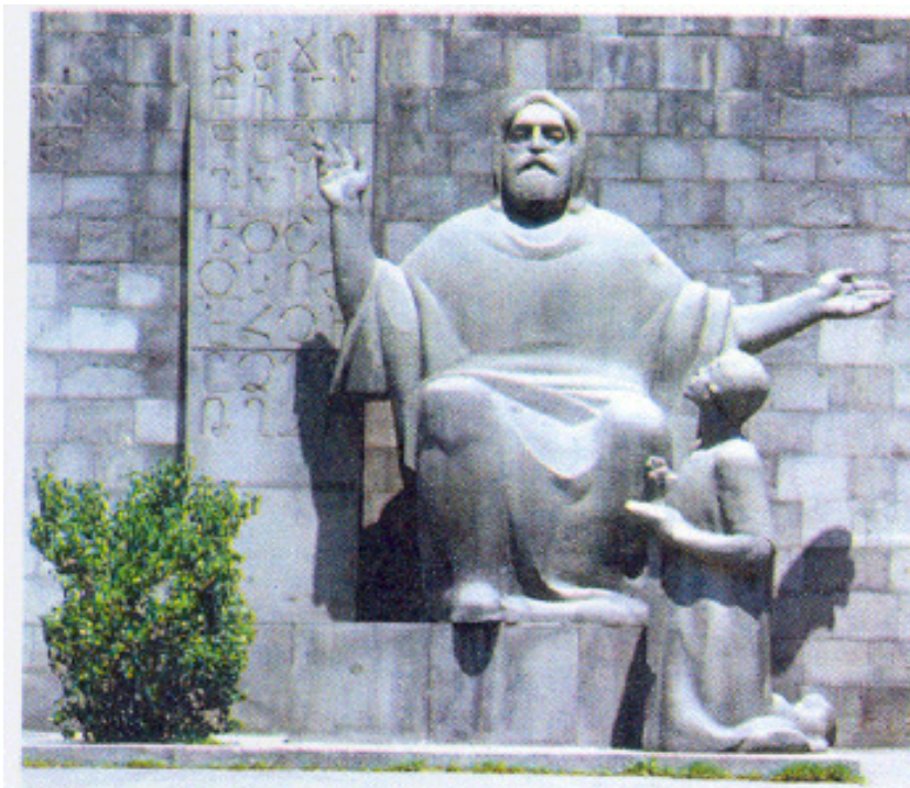
Մեսրոպ Մաշտոցի արձանը՝ Մատենադարանի մուտքին