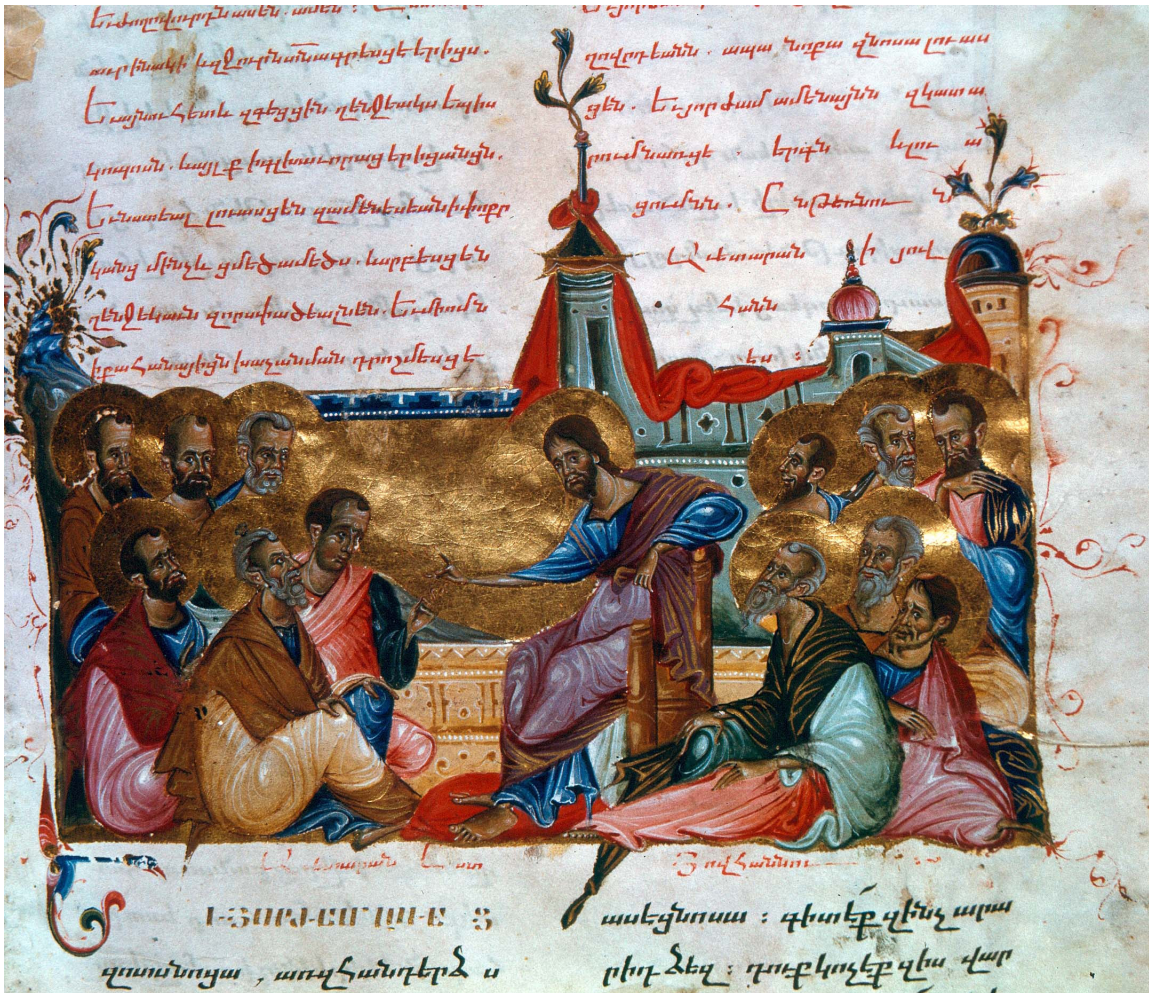
Յիսուս կը քարոզէ Առաքեալներուն