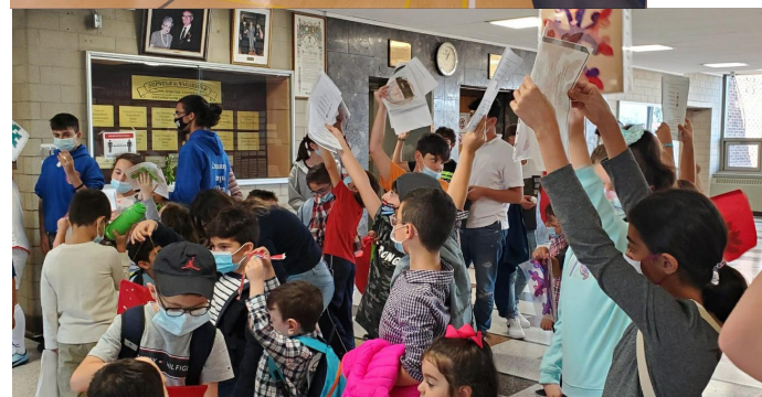
Նշելու համար Խաչվերացը, աշակերտները խաչեր պատրաստեցին...: