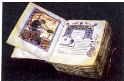
Միջնադարեան Հայ Չեռագիր, ԺԲ դար

Բոլորիս ծանօթ է նաեւ այն իրողութիւնը թէ առաջին գիրքը, որ հայերէնի կը թարգմանուի 408-415 թուականներուն միջեւ, Սուրբ Գիրքի Հին ուխտն էր կատարուած Եօթանասնիցէն: Նոյնքան հետաքրքրական է նաեւ զիտնալ թէ Նոր Ուխտի հայերէն լեզուով թարգմանութիւնը եղած է ասորերէն հին թարգմանութեան մը հետեւողութեամբ: Այս թարգմանութիւնն է որ կոչուած է «փութանակի թարգմանութիւն», որ կը նշանակէ հապճեպով, անապարանքով կատարուած թարգմանութիւն: