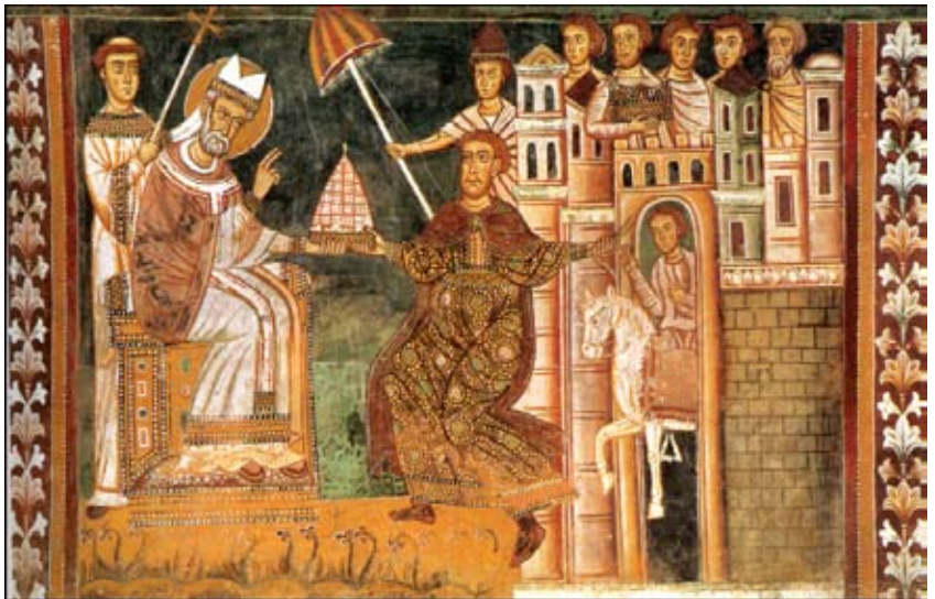
Միլվեսթր Ա. Հռոմի Պապը եւ Կոստանդիանոս կայսրը

Հեղինէ թագուհին Երուսաղէմի եւ շրջակայքին եկեղեցիներ եւ կուսանոցներ կառուցել կու տայ: Մահացած է 330 թուականին քրիստոնէաներու սրտերուն թողելով բարի յիշատակ: