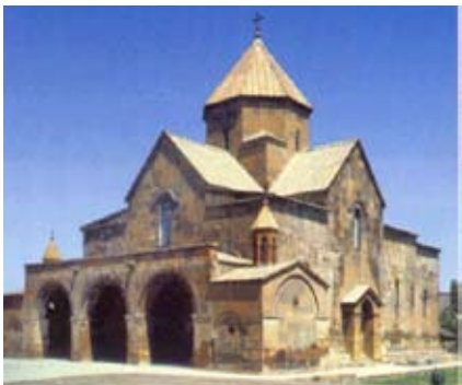
Էջմիածնի Ս. Գայիանէ Վանքը