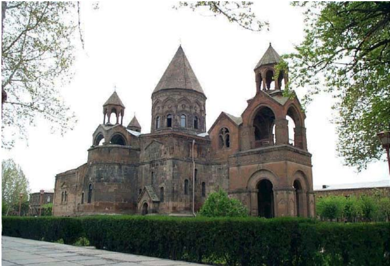
Ս. Էջմիածնի Մայր Տաճար