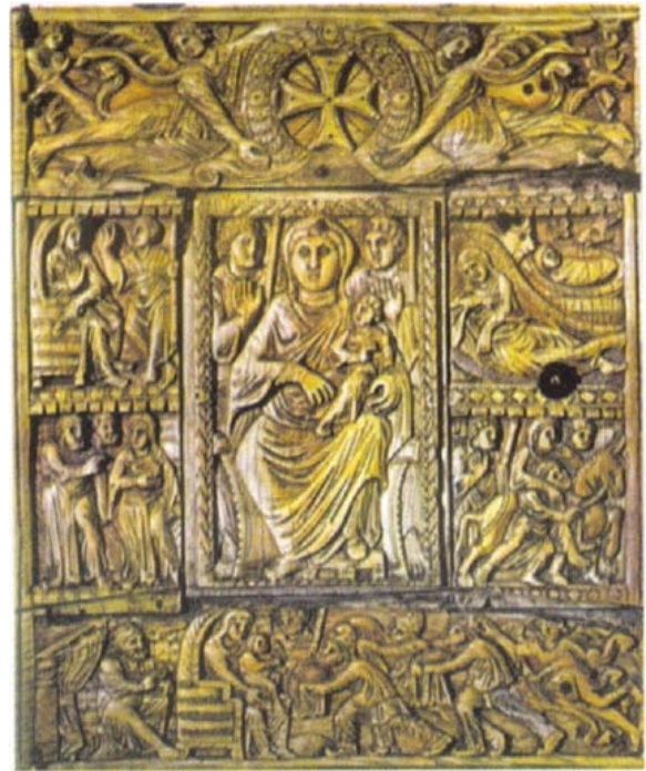
Էջմիածնի Աւետարանին Փղոսկրեայ կազմը

«Էջմիածնի Հոգեւոր Ճեմարան» Հոգեւոր բարձրագոյն գիշերօթիկ ուսումնական հաստատութիւն հիմնուած 1945 Նոյեմբեր 1-ին Գեորգ Չորեքչեանի նախաձեռնութեամբ: 1998-ին Գարեգին Ա. Ամենայն Հայոց Կաթողիկոսի կողմէ վերանուանուեր է Գեորգեան Հոգեւոր Ճեմարան: