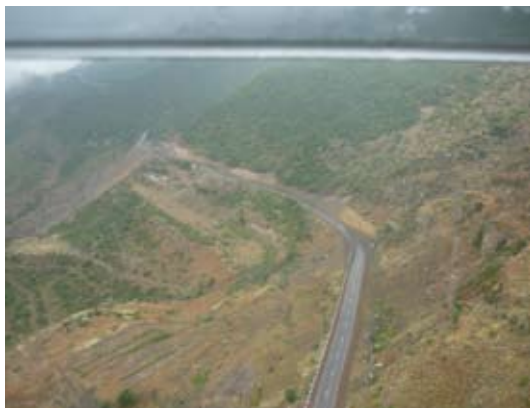
Ճոպանուղին վար դիտուած

Ճոպանուղին կը շարժի ժամական 37 քմ արագութեամբ եւ 11 վայրկեանէն Հալիձորէն Տաթևի վանք կը հասնի: