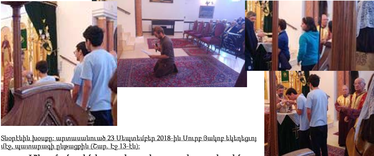
Տնօրէնին խօսքը: արտասանուած 23 Սեպտեմբեր 2018-ին Սուրբ Յակոբ եկեղեցւոյ մէջ, պատարագի ընթացքին (Շար. Էջ 13-էն):

Լուրեր` Կիրակնօրեայէն «Կիրակի 23 Սեպտեմբերին, Ս. Յակոբ Կիրակնօրեայ Դպրոցի աշակերտ-աշակերտուհիները Ս. Հաղորդութիւն ստանալու համար եկեղեցի եկան: Նախ հետեւեցան Ս. Պատարագին, ներկայ եղան Հայաստանի Վերանկախացման նուիրուած Մաղթանքի արարողութեան, ապա հաղորդուեցան: