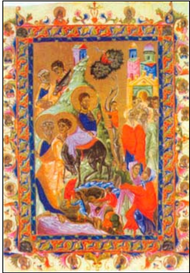
«Մուտք Երուսաղեմ» Մանրանկար՝ Ջեթում Բ. թագաւորի ճաշոցէն 1286 Կիլիկիա

- Կ'ըսեմ ձեզի, որ եթէ ատոնք լռեն՝ քարերը պիտի աղաղակեն: