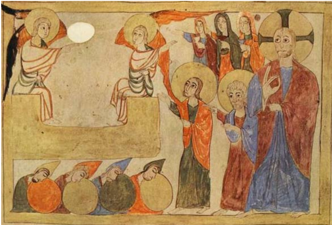
Աւետարան, 1038 թ. Զրեշտակի յայտնութիւնը իւղաբեր կանանց

Աւագ Չորեքշաբթի օրուայ աւետարանական ընթերցումը կը յորդորէ չչարաշահել Աստուծոյ ունեցած սէրն ու վստահութիւնը և, յիշելով մարդկութեան համար անոր կրած չարչարանքներն ու մահը, չշեղիլ ճշմարիտ ճանապարհէն, երկրպագել ու փառաւորել զԱստուած: