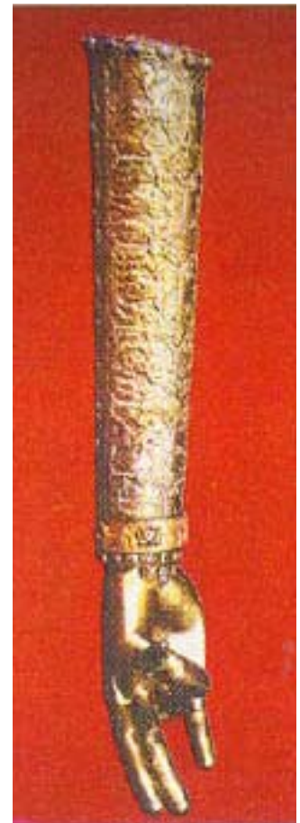
Սուրբ Գրիգոր Լուսավորիչի Աջը

Մեծ պահքի շրջանին, եկեղեցիներէն ներս խորանները փակ կը մնան: Միակ բացառութիւնն է Ս. Գրիգոր Լուսավորչի «Մուտն ի Վիրապ» տօնի առիթով (այս տարի Մարտ 17-ին) մատուցուած պատարագը որ կը կատարուի բաց խորանով: