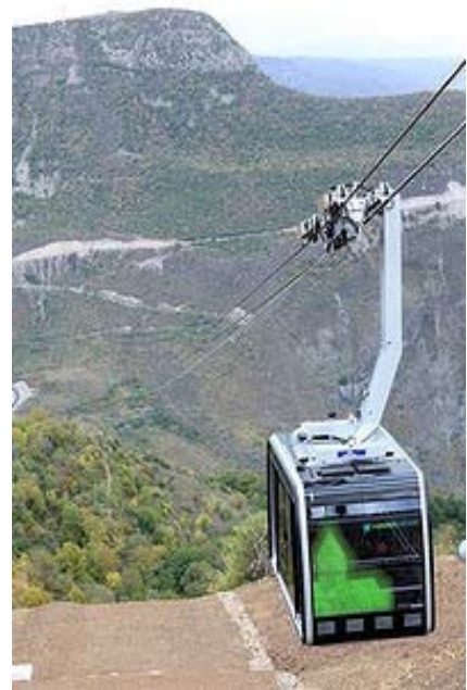
Ճոպանուղիէն վար դիտուած

Ճոպանուղին կը շարժի ժամական 37 քմ արագութեամբ եւ 11 վայրկեանէն Հալիձորէն Տաթևի վանք կը հասնի: