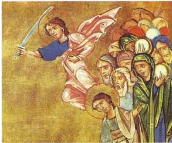
Միքայել հրեշտակապետը Իսրայելի ժողովուրդին համար մարտնչելու ընթացքին: Երուսաղէմ, ձեռ. 2027, էջ 4բ, Աստուածաշունչ 1266 թ. Կիլիկիա, ծաղկող Թորոս Ռոպին

Նոյեմբեր ամսուան առաջին կամ երկրորդ Շաբաթ օրը, Հայց. Եկեղեցին կը յիշատակէ հրեշտակապետեր Գաբրիելի եւ Միքայելի տօնը: Հրեշտակ կը նշանակէ պատգամաւոր, առաքեալ «ղրկուած»: Նախապէս անոր կը տրուէր երկնային դեսպան, պատգամաւոր, եւ կամ սուրհանդակ նշանակութիւնը: Աստուածաշունչը կը վկայէ որ հրեշտակները իբրեւ լուսեղէն՝ ստեղծուած են առաջին օրը, լոյսի հետ միասին: Անոնք ժամանակի ներգործութենէն չեն ազդուիր եւ սեռային յատկանիշներ չունին: