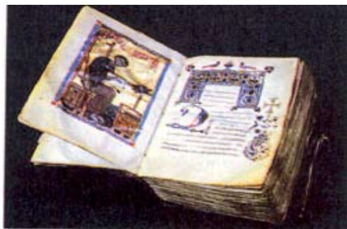
Միջնադարեան Հայ Չեռագիր, ԺԲ դար

Բոլորիս ծանօթ է նաեւ այն իրողութիւնը թէ առաջին գիրքը, որ հայերէնի կը թարգմանուի 408-415 թուականներուն միջեւ, Սուրբ Գիրքի Հին ուխտն էր կատարուած Եօթանասնիցէն: Նոյնքան հետաքրքրական է նաեւ զիտնալ թէ Նոր Ուխտի հայերէն լեզուով թարգմանութիւնը եղած է ասորերէն հին թարգմանութեան մը հետեւողութեամբ: Այս թարգմանութիւնն է որ կոչուած է «փութանակի թարգմանութիւն», որ կը նշանակէ հապճեպով, անապարանքով կատարուած թարգմանութիւն: